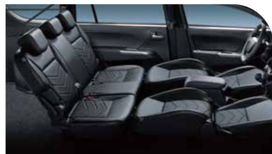
前座椅全平躺功能