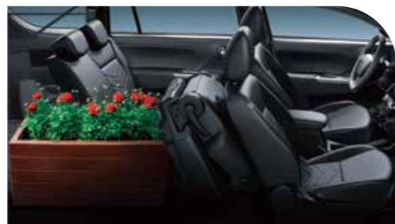
二排單邊座椅前翻摺疊