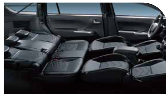
車室座椅全平躺功能