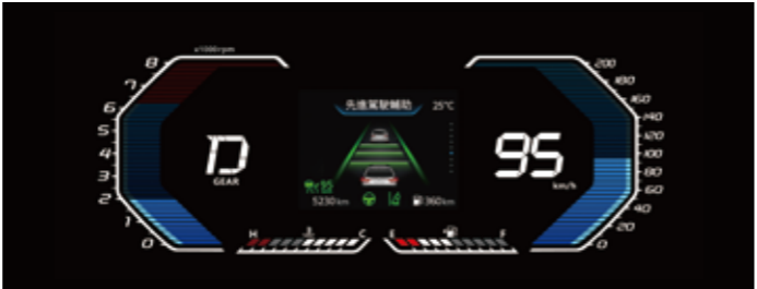
5人/7人標緻型、豪華型 ▶