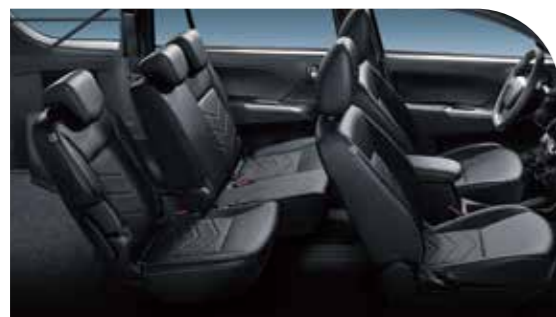
二排6/4分離座椅前後滑動