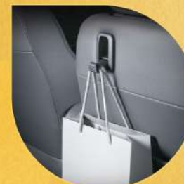
前乘客座椅椅背掛勾