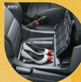
前乘客座椅前翻置物