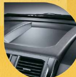
中控台上方置物空間