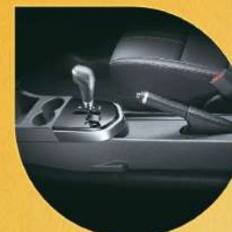
整合式中央置物盒 (零錢盒 / 置杯架 / 置物盒)