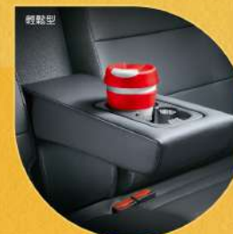
後座中扶手附雙置杯座