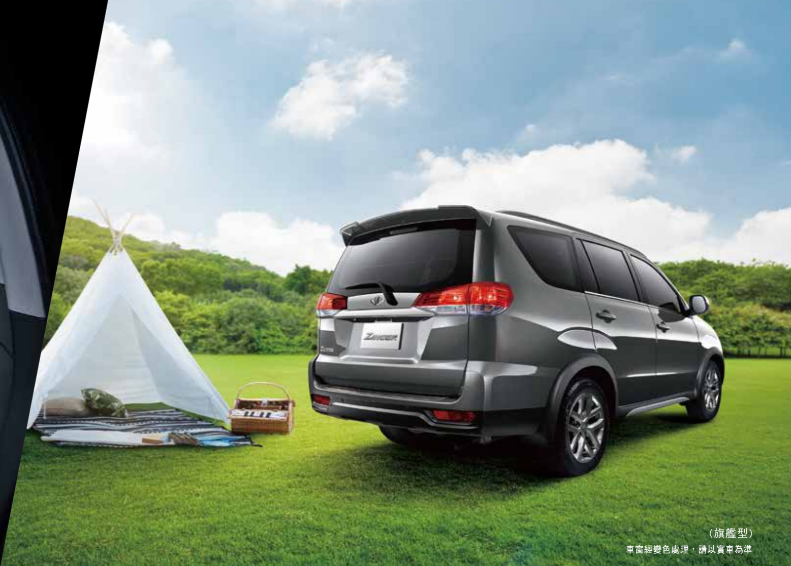
(旗艦型) 車窗經變色處理，請以實車為準