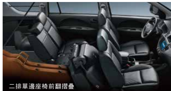
二排單邊座椅前翻摺疊