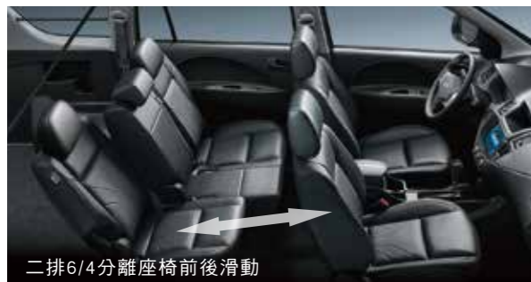
二排6/4分離座椅前後滑動

車廂空間大、尾門開口寬敞、底板空間平整，三大優勢讓載貨輕鬆搞定，出遊開心盡興 座艙多變組合，適用不同空間需求；全新勁黑質感座椅，舒適大方