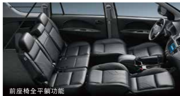
前座椅全平躺功能