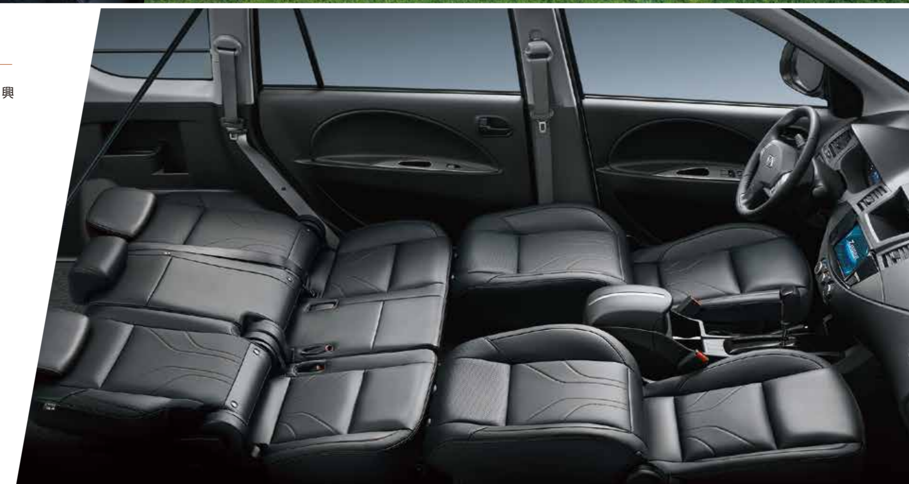
車室座椅全平躺功能